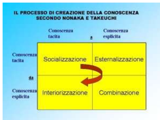
Figura 1. Schema del processo di creazione della conoscenza

A questo punto siamo di nuovo in presenza di conoscenza tacita dalla quale si può nuovamente innescare il processo creativo di nuove conoscenze. A questo punto risulta svelata la natura di spirale del processo di creazione di conoscenza descritto da Nonaka e Takeuchi attraverso il modello SECI (Socializzazione, Esteriorizzazione, Combinazione, Interiorizzazione).